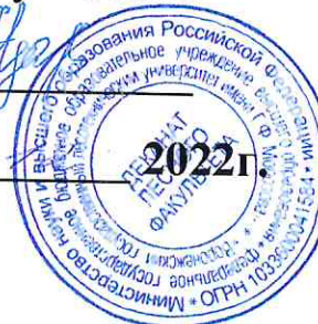
ГРАФИК ЭКЗАМЕНАЦИОННОЙ СЕССИИ ЛЕСНОГО ФАКУЛЬТЕТА